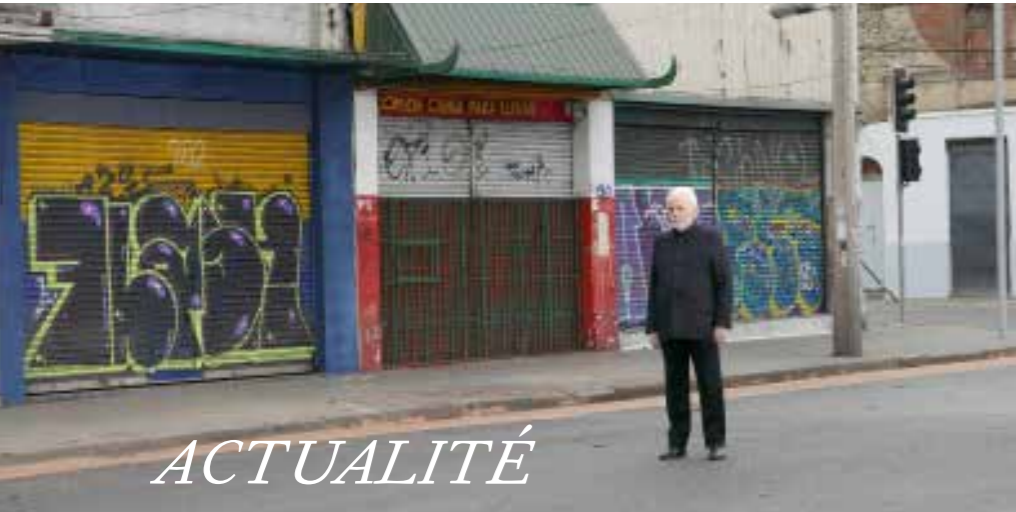
Poesía sin fin d'Alejandro Jodorowsky