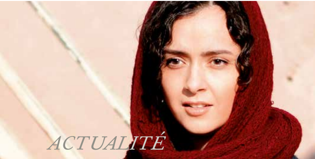
Le Client d'Asghar Farhadi