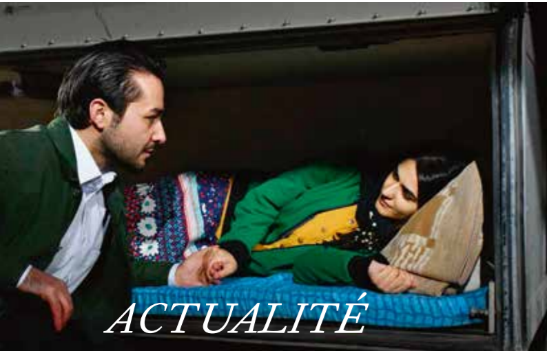
Close up d'Abbas Kiarostami