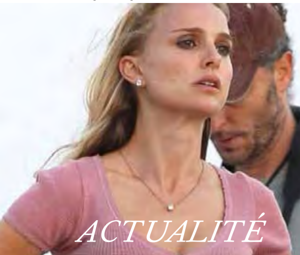
Song to Song de Terrence Malick