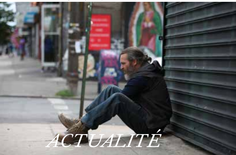
Timothy Spall dans Le Procès du siècle de Mick Jackson