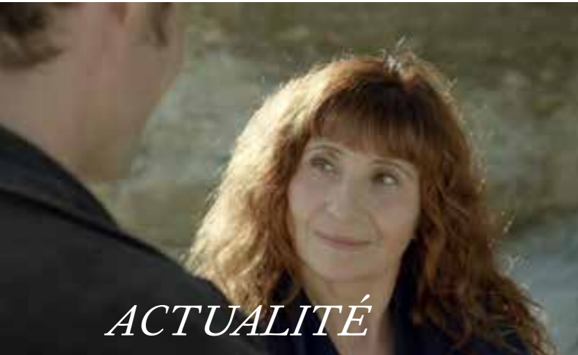
L'Assassinat du Père Noël de Christian-Jaque (production Continental)